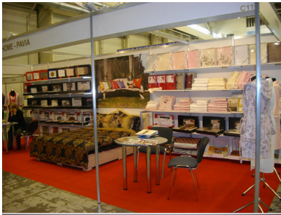
СНИ І СЕКРЕТИ

08.07.2011 12:36 - Обновлено 26.07.2011 11:39